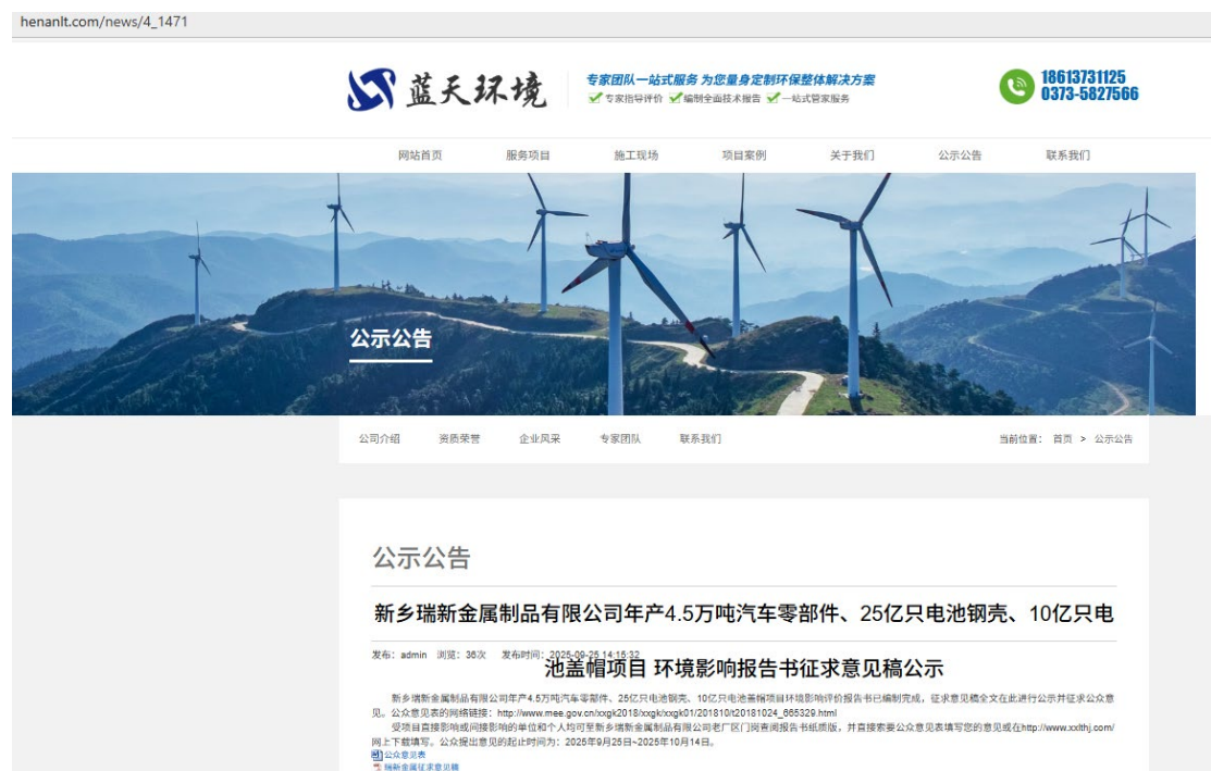
图 2 征求意见稿公示截图

新乡瑞新金属制品有限公司年产 4.5 万吨汽车零部件、25 亿只电池钢壳、10 亿只电池盖帽项目在 2025 年 9 月 25 日在蓝天环境网对其环境影响报告书征求意见稿全文进行了公示，并提供了公众参与意见表的索取和下载方式。公示网站： http://henanlt.com/ ，公示时间：2025 年 9 月 25 日~2025 年 10 月 14 日。网络平台选取、公示时间和公示内容符合要求。公示截图如下：